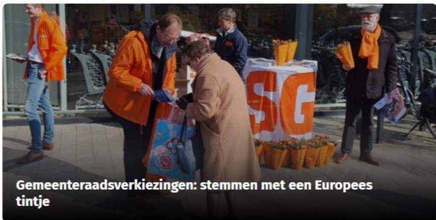
Gemeenteraadsverkiezingen: stemmen met een Europees tintje

Tip: abonneer je op www.brusselsenieuwe.nl